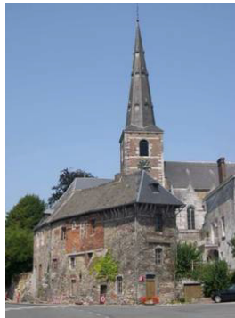
Eglise de la Visitation