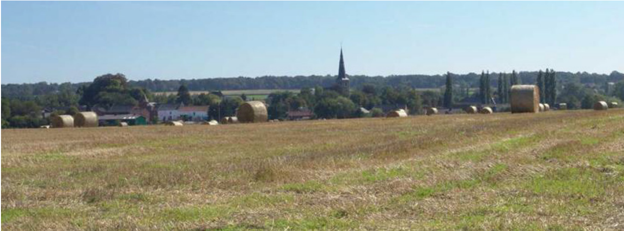
Nalignes, au cœur de la clairière