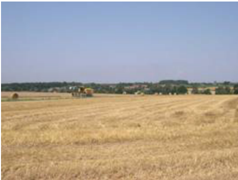
Le hameau de la Grogerie, en lisière forestière