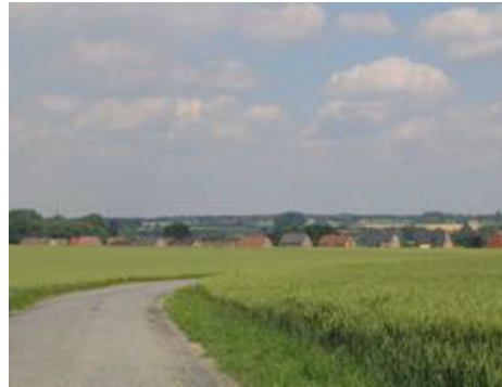
Habitat le long du réseau routier