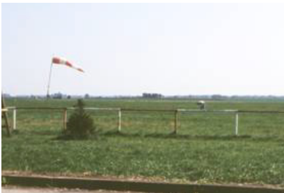
Paysage de champs ouverts, l'aérodrome de la Salmagne.