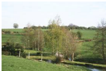
Une variation dans le plateau : le vallon du ruisseau de l'Hôpital, affluent de la Trouille.