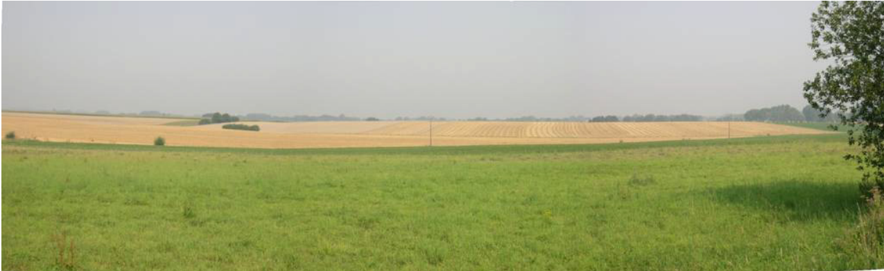
Le plateau au sud de Vieux-Reng et Grand-Reng vu, depuis Gilot.