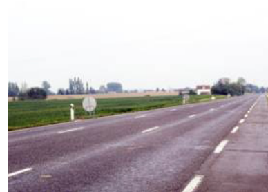
Vue depuis la RD 2 au nord de Maubeuge.