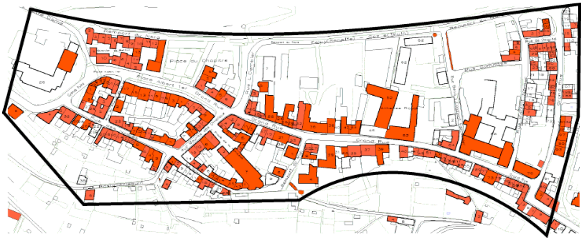
Carte 2 : Thuin Ville Haute, le patrimoine de grande valeur architecturale ( foncé ) et de bonne valeur d'ensemble ( clair ). Le trait continu matérialise le périmètre de la Ville Haute. En dehors du patrimoine monumental de grande valeur, le tissu urbain de la Ville Haute est composé des vastes ensembles homogènes de grande qualité, ce qui rehausse l'intérêt de la découverte de l'endroit (fond de plan extrait du plan PICC du MET d432, licence D432/9906/001/Espace Environnement).