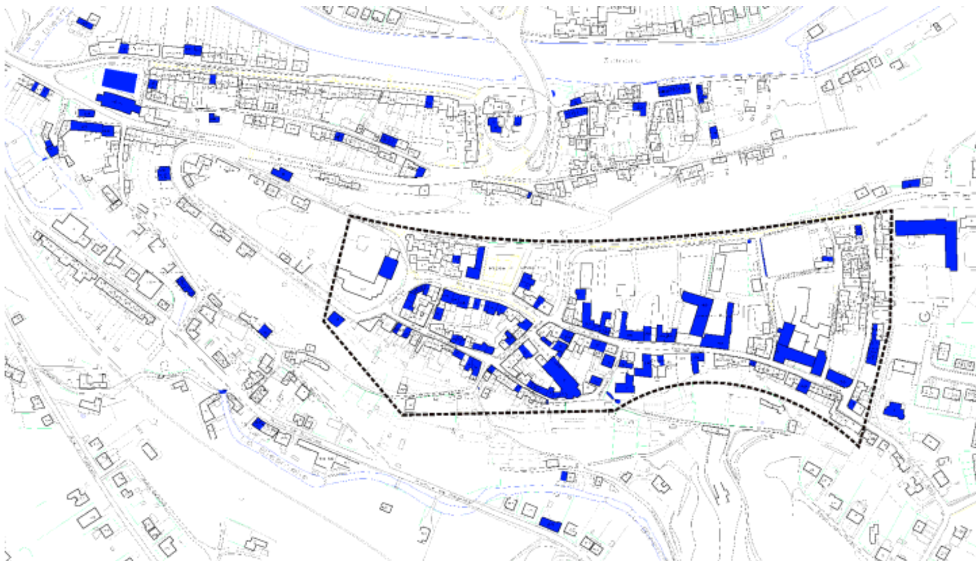
Carte 1 : Thuin-Centre, le patrimoine de grande valeur architecturale est repris en bleu (gris sombre si copie noir et blanc) et le tracé retenu pour délimiter le périmètre de la Ville Haute en pointillé. Le patrimoine de grande valeur architecturale se concentre visiblement à la Ville Haute, ce qui facilite la découverte pédestre (fond de plan extrait du plan PICC du MET D432, licence D432/9906/001/Espace Environnement).