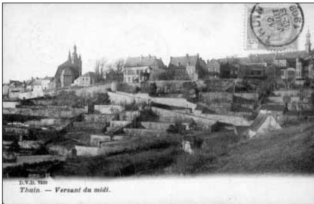
Figure 2 : La Ville Haute et les Jardins Suspendus tels qu'ils pourraient réapparaître après rénovation. Les bâtiments et les murs des jardins sont dégagés et visibles. (Ancienne carte postale, vue prise vers 1900).

A plus long terme, des interventions sont également envisageables sur la Grand'rue (mise en semi-piétonnier), la rue Cambier et la chapelle des Soeurs Grises. On remarque que les projets à brève échéance répondent en partie aux attentes principales de la population (voir carte 3), les projets à plus long terme y répondant mieux. Cependant, seules une approche et une intervention globales et cohérentes peuvent permettre à la Ville Haute de pouvoir encore assurer entièrement et durablement ses différentes fonctions envers ses habitants, les usagers de l'entité et les visiteurs. Une stratégie de petites retouches successives suivant des impératifs immédiats ou particuliers ne peut garantir pleinement d'aussi bons résultats en termes urbanistiques et de satisfaction des différents usagers qu'avec une vue d'ensemble de la rénovation de la Ville Haute.