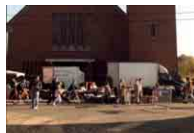
Foire aux pommes.