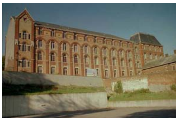
Les Arts et Métiers