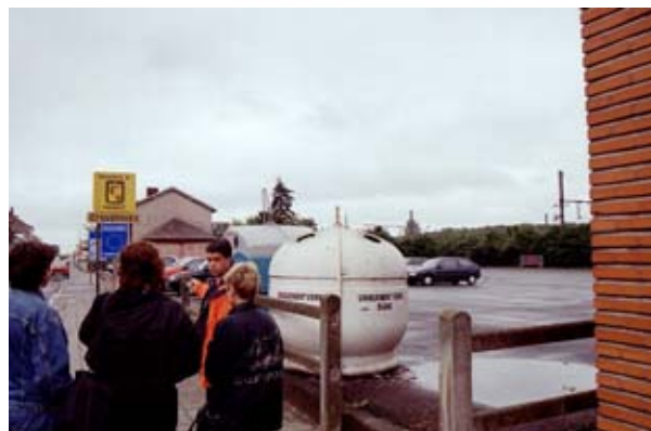
rue Albert I er , parking