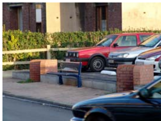
rue Albert I er , parking